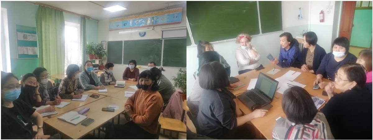
Заседания школьных методических объединений по теме «Разработка дифференцированных заданий. Реализация дифференцированного подхода к учащимся на различных этапах урока»