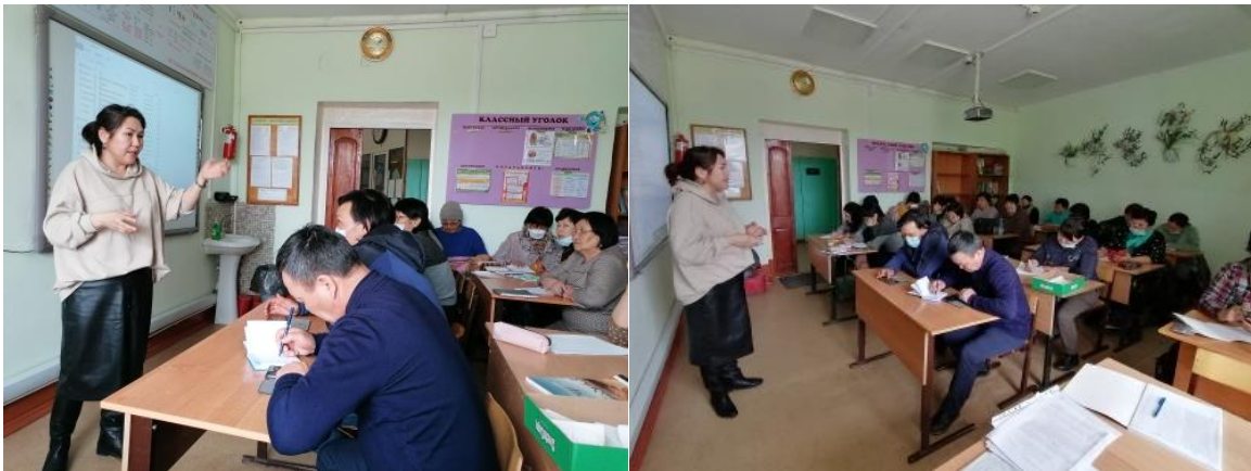
Информационно-методическое совещание «Методы и приемы индивидуализированного обучения».